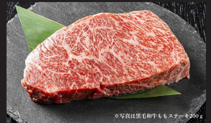
※写真は黒毛和牛ももステーキ200g