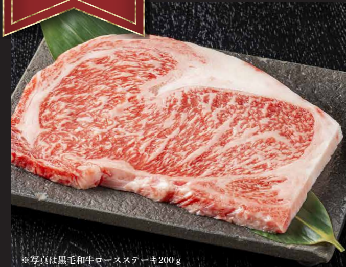
※写真は黒毛和牛ロースステーキ200g